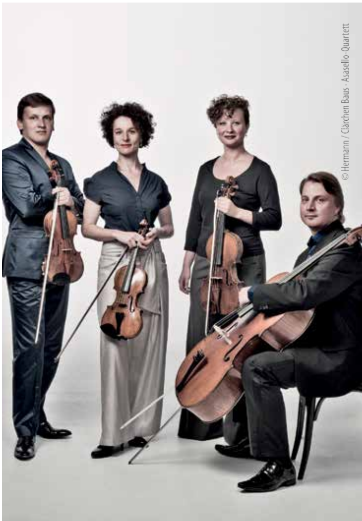
© Hermann / Clärchen Baus - Asasello-Quartett

DO. 9. MÄRZ • 19:30 UHR • MARTINSKIRCHE KONZERT IN DER MARTINSKIRCHE